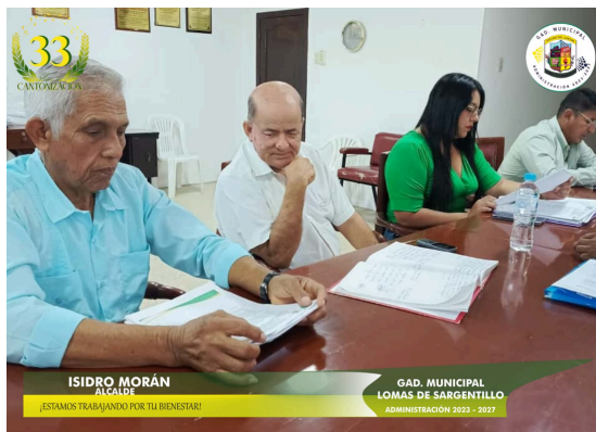
33 CANTONIZACIÓN ISIDRO MORÁN ALCALDE ¡ESTAMOS TRABAJANDO POR TU BIENESTAR! GAD. MUNICIPAL LOMAS DE SARGENTILLO ADMINISTRACIÓN 2023 - 2027